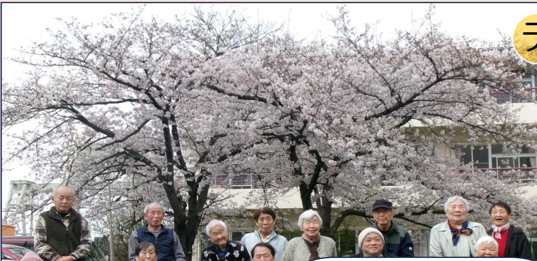
皆さんの笑顔も満開です！！

例年は3月末に満開を迎える里仁館の桜も今年は気候の影響で開花が遅れていました。4月の1週目にようやく開花し、天気の良い日に皆さんとお花見することができました。「やっぱり桜は綺麗ね。」「お花見ができて良かった。」との感想をいただきました。満開の桜の下でクイズや春の歌で楽しい一時を過ごしました。